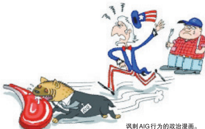
讽刺AIG行为的政治漫画。

“我注意到美国民众的愤怒以及总统对严控薪酬机制的呼吁,”利迪在文中写道,“但纳税人应该知道,政府对AIG的救助产生了积极作用,有助于稳定公司乃至整个金融体系。纳税人还应该知道的是,AIG有计划把钱还给政府,而我们正取得进展。”AIG15日以不能违反公司与高管先前签订的合同为由,决定向部分高管支付1.65亿美元奖金,在世界范围内引起震惊和愤怒。