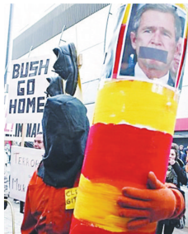
示威者们不遗余力地嘲讽布什。