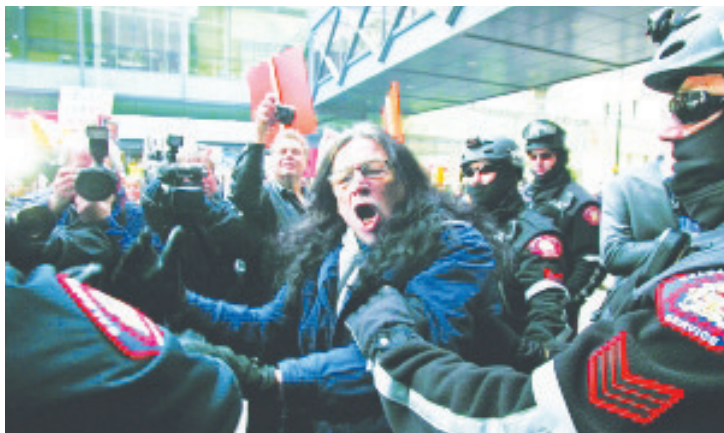
欲闯入会场“逮捕”布什的示威者情绪非常激动。

场外,也有两名支持布什的加拿大人与示威者唱对台戏。这两名男子手持“这世界因为布什变得安全多了”的标语,并高喊“谢谢你,布什”。据悉,当天的演讲吸引了近2000名商界人士参加,有报道称一些听众席位叫价达到了3100美元。目前,主办方尚未透露布什此番演讲的酬劳,但先前有媒体称,布什每场演讲所获得的酬劳为15万美元。