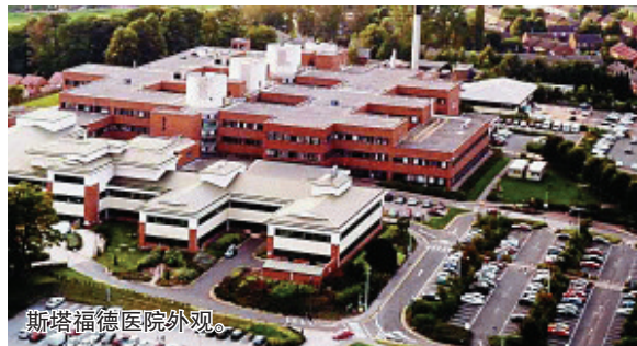
斯塔福德医院外观

虽然这家医疗机构首席执行官马丁·耶茨和总裁托尼·布里斯比已于本月初辞职,但社会活动人士认为失职机构可能不止一家,要求彻查。卫生保健委员会眼下调查12家国家医疗服务系统托拉斯。肯尼迪说,尚未发现这些机构存在同样严重的问题。