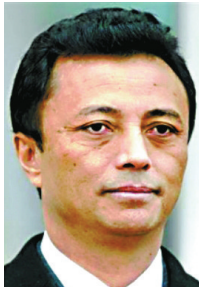
原总统拉瓦卢马纳纳。

法新社说,现年59岁的拉瓦卢马纳纳可能选择流亡海外。他上周失去军队控制权后,大部分家人已离开国内。拉瓦卢马纳纳2002年上任,2006年竞选连任成功,第二个任期原定于2011年结束。