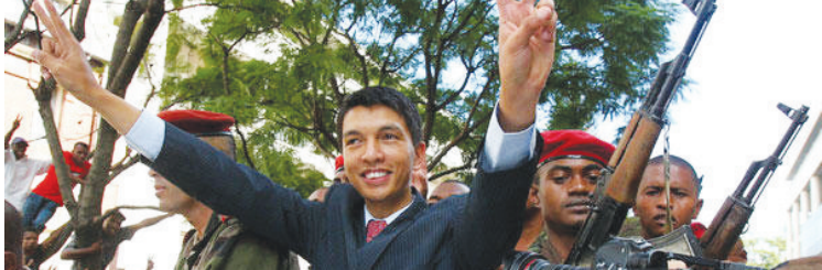
3月17日,帅气的拉乔利纳(中)在街上巡游时做出胜利的手势。

虽然距离现行宪法总统最低就职年龄仍有差距,但马达加斯加宪法最高法院18日宣布,承认年仅34岁的反对派领导人拉乔利纳为该国总统。在此之前,马达加斯加总统马克·拉瓦卢马纳纳17日宣布辞职并将权力移交给军方。支持反对派的将领拒绝由军队接管政府。军方最高将领当晚宣布将权力交给反对派领导人安德里·拉乔利纳。拉乔利纳随后接受媒体采访时说:“你们现在可以叫我总统”。