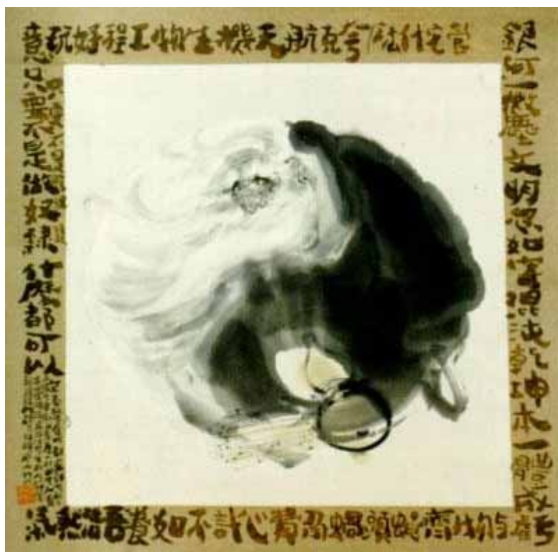
高尔泰作品：老子，1991，水墨