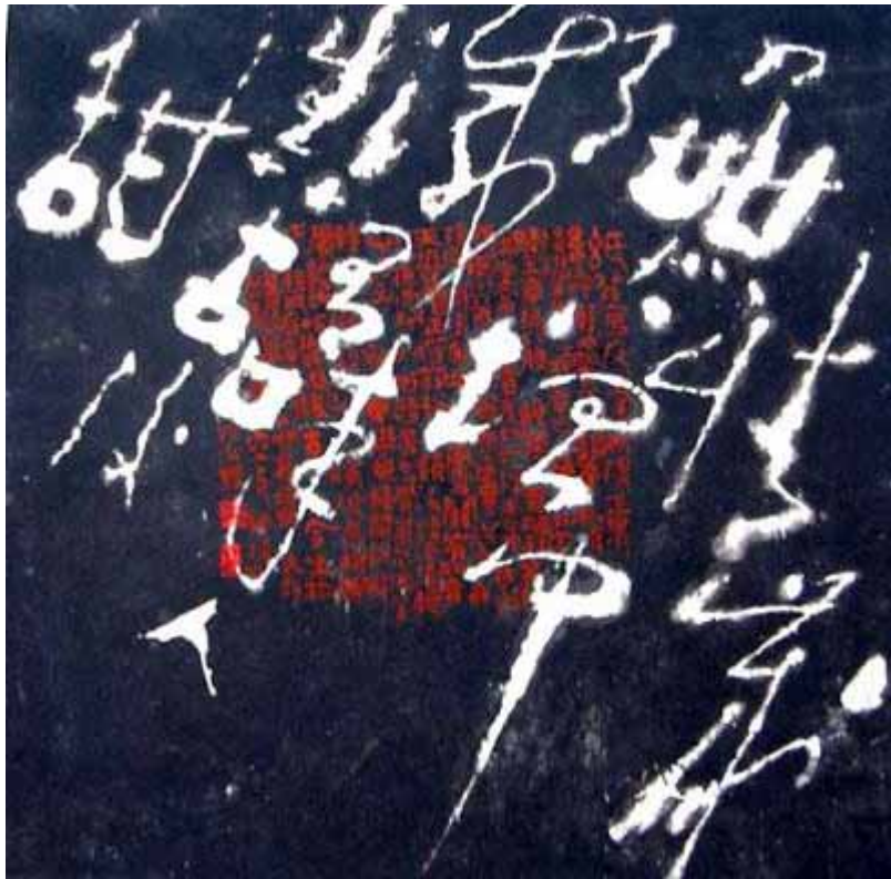
2003年在纽瓦克博物馆展出的高尔泰作品：「无情岁月增中减，有味人生苦后甜」，纸背写反字而得正果。